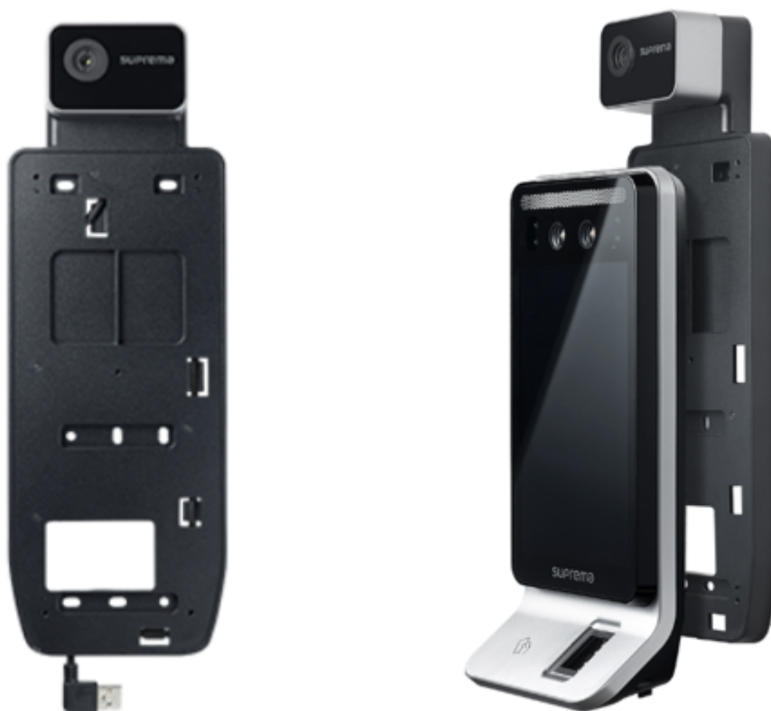
Suprema Thermal Camera TCM10-FSF2